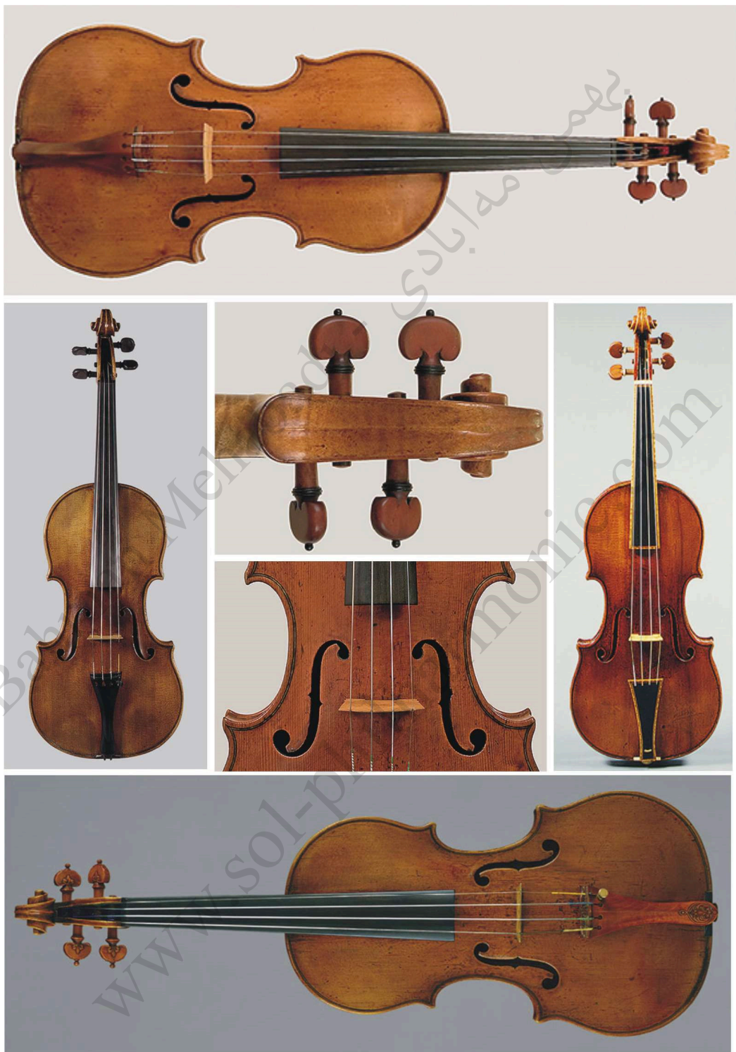
کلکسیون از آماتی an Amati collection