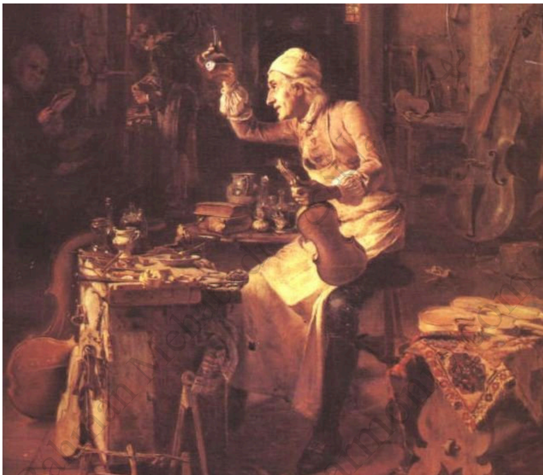
استرادیواری در کارگاهش Stradivari in his workshop

او در تمام دوران طولانی زندگی‌اش، با دقت، عشق و علاقه‌ای وافر به ساز و موسیقی، کارگاهش را ترک نگفت و بر روی بسیاری از آخرین کارهایش، با غرور و احترام و سرافرازی و خضوع، تاریخ ساخت ساز را نوشت. در یکی از این سازها، به نام رُد ۲۰ ساخته شده در سال ۱۷۳۳ در قسمت برجستگی دسته آن آمده است: محصول ۸۹ سالگی.