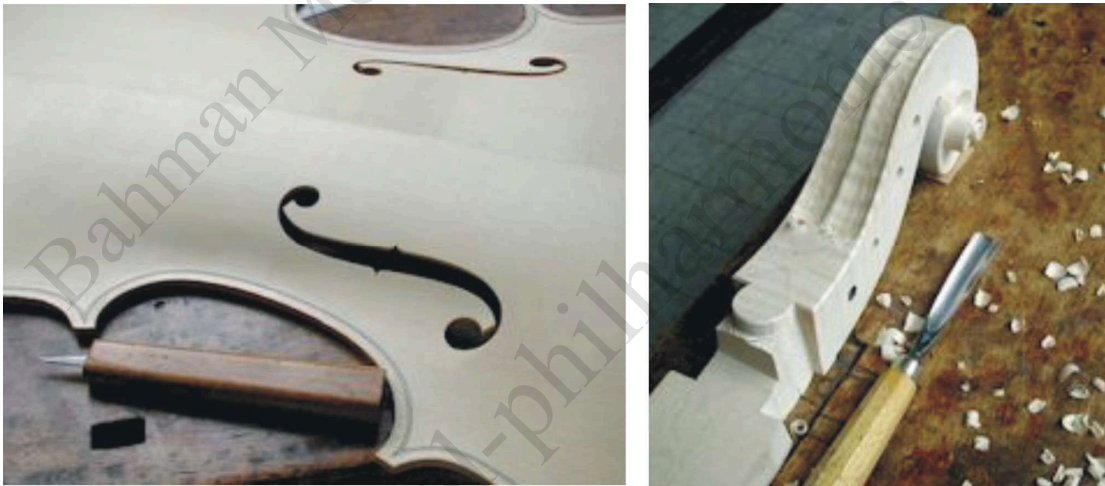
چلو از گوارنری a Guarneri Cello

ویلن‌های کرمونایی ایتالیا، در گذر سال‌های طولانی برای نبوغ آماتی‌ها، برای رنسانس ایتالیا و برای همه سازندگان سازهای مختلف از ابتدا تا کنون، احترام و تکریم به ارمغان آورده‌اند. امروزه نیز سازندگان پر قدرتی در جهان دست به کار ساختن ویلن‌های ارزشمندی هستند که یکی از ویلن‌های کرمونا را به عنوان مدل خود بر می‌گزینند. در حال حاضر سازهایی در اندازه‌های مختلف حتی برای کودکان خردسال